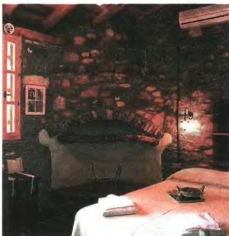
Ξενώνες, κώροι εστίασης, εναλλακτικές μορφές τουρισμού, μονάδες οικοτεχνίας και καταστήματα παραδοσιακών προϊόντων είναι μερικές από τις επενδύσεις που μπορούν να ενταχθούν στο πρόγραμμα Leader

■ Η δημιουργία συνθηκών πολυαπασχόλησης και διαφοροποίησης της αγροτικής οικονομίας μέσα από την ανάπτυξη πλέγματος μεταποιητικών και τουριστικών δραστηριοτήτων, αξιοποιώντας τους φυσικούς πόρους και τις πολιτιστικές παραδόσεις της περιοχής, την παραγωγή προϊόντων του αγροδιατροφικού τομέα και την τοπική γαστρονομία.