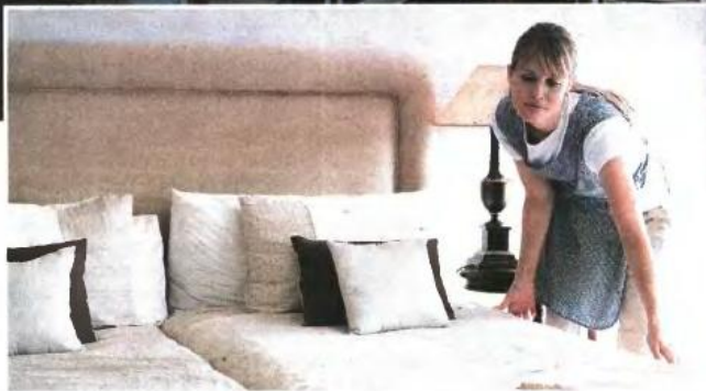
Τα ποσοστά επιχορήγησης εξαρτώνται από το μέγεθος της επιχείρησης και από την περιφέρεια στην οποία εδρεύει και κυμαίνονται από 15% έως 50%

(τρείς ζώνες) όπου βρίσκεται η περιοχή τους και το μέγεθος της επιχείρησής τους (μεγάλες, μεσαίες και μικρές) κυμαίνονται από 15% έως 50%.