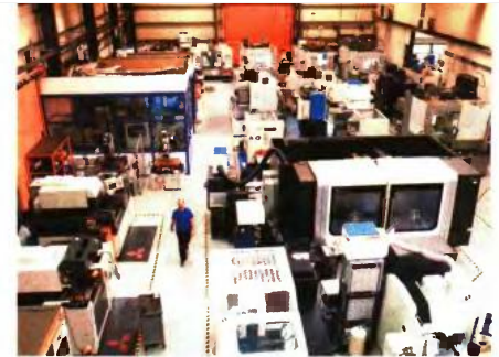
Κάθε χρόνο η εταιρεία επενδύει πάνω από το 10% του τζίρου της σε νέο εξοπλισμό