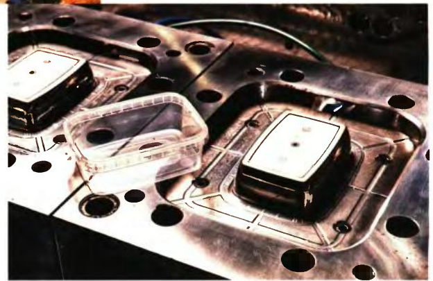
Τα καλούπια από τα οποία βγαίνουν πλαστικά μπουλ φαγητού