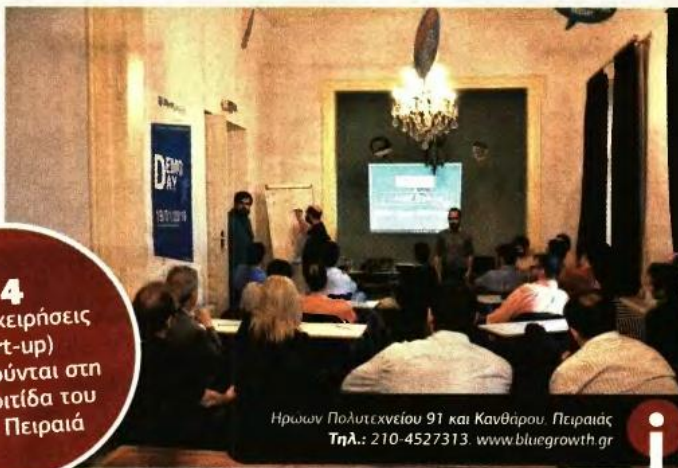
Ηρώων Πολιτεχνείου 91 και Κανθάρου, Πειραιάς Τηλ.: 210-4527313. www.bluegrowth.gr

14 νέες επιχειρήσεις (start-up) φιλοξενούνται στη θερμοκοιτίδα του δήμου Πειραιά