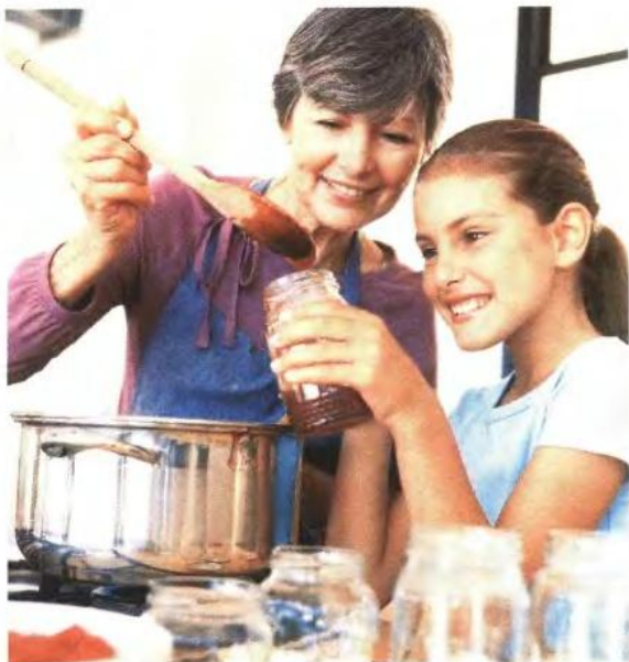
Το συνολικό κόστος ανά επένδυση δεν μπορεί να ξεπεράσει τα 300.000€

Συγκεκριμένα για το Μέτρο 311: «Διαφοροποίηση προς μη γεωργικές δρα-