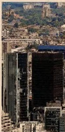
Η μεταφορά έδρας μιας μικρής ΕΠΕ στο Λονδίνο φαίνεται να είναι πλέον συνθημιμένη υπόθεση για τα ξένα νομικά γραφεία.

• Μεταφορά της υφιστάμενης έδρας στο Λονδίνο. Η λύση αυτή συ-