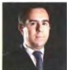
Νεκτάριος Μιτροράκης Υπουργός Ανάπτυξης