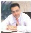
Αβράμ Γιάννης Υπουργείο Οικονομικών