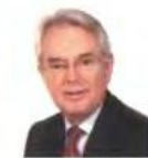
Christopher Eggleton Minoan Group Plc