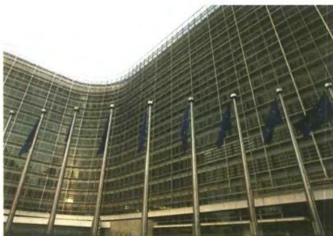
Περισσότερες επενδύσεις από τα κράτη-μέλη που διαθέτουν δημοσιονομικά περιθώρια ζητεί η Ευρωπαϊκή Επιτροπή.

Στη συμπλήρωση - βελτίωση του θεσμικού πλαισίου σχεδιασμού και υλοποίησης των δημοσίων και στρατηγικών επενδύσεων προκώρα το υπ. Ανάπτυξης με τροπολογία που κατέθεσε στη Βουλή. Προβλέπει ότι σε εκτάσεις με μικτό καθεστώς ιδιοκτησίας, που δεν έχουν περιέλθει στην αρμοδιότητα του ΤΑΙΠΕΔ, καταρτίζονται και εγκρίνονται ΕΣΧΑΣΕ (Ειδικά Σχέδια Χωρικής Ανάπτυξης Στρατηγικών Επενδύσεων) αντί των ΕΣΧΑΔ.