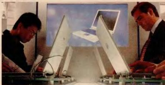
Το ισχυρότερο κίνητρο για να ξεκινήσουν οι Έλληνες επιχειρηματική δράση είναι, σύμφωνα με την έρευνα, ότι θέλουν να είναι «αφεντικά του εαυτού τους».

Γενικά οι Έλληνες διακρίνονται θετικά στην επιχειρηματικότητα σε ποσοστό 70%, κοντά στον παγκόσμιο μέσο όρο που είναι 75% και τον κοινοτικό μέσο όρο που είναι 73%. Πιο θετικοί απέναντι στην επιχειρηματικότητα είναι οι Σουηδοί (94%) και ακολουθούν οι Μεξικανοί και οι Νορβηγοί (ποσοστό 93% και στις δύο χώρες). Στις τρεις τελευταίες θέσεις από την άλλη βρίσκονται η Αυστρία (60% των ερωτηθέντων είναι θετικοί έναντι της επιχειρηματικότητας), η Γερμανία (56%) και η Σλοβακία (55%). Σελ. 20