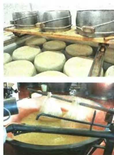
▲ Η CREDITO EMILIANO ελέγχει συστηματικά τα 440.000 κεφάλια παρμεζάνας που της εμπιστεύονται για να πάρουν δάνεια οι κτηνοτρόφοι στην Εμίλια Ρομάνια της Ιταλίας