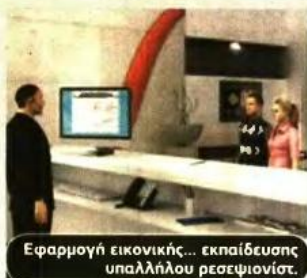
Εφαρμογή εικονικής... εκπαίδευσης υπαλλήλου ρεσεψιονίστ.