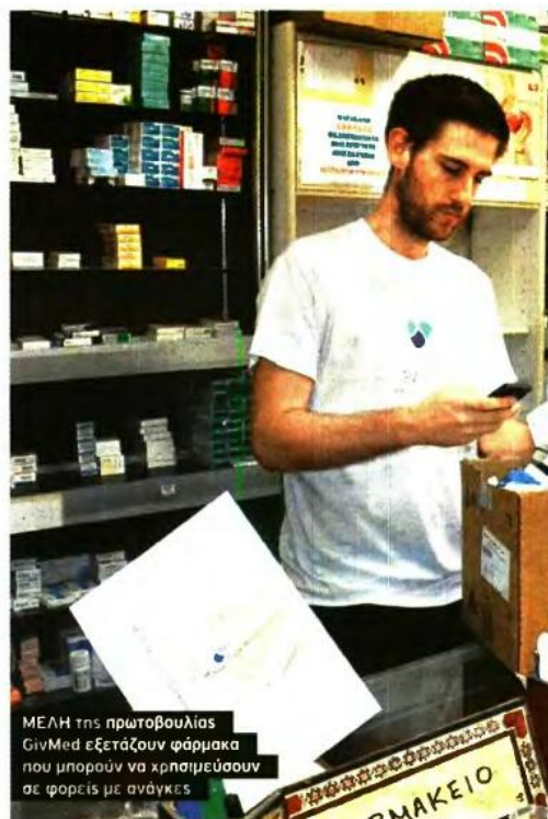
ΜΕΛΗ της πρωτοβουλίας GivMed εξετάζουν φάρμακα που μπορούν να χρησιμοποιηθούν σε φορείς με ανάγκες