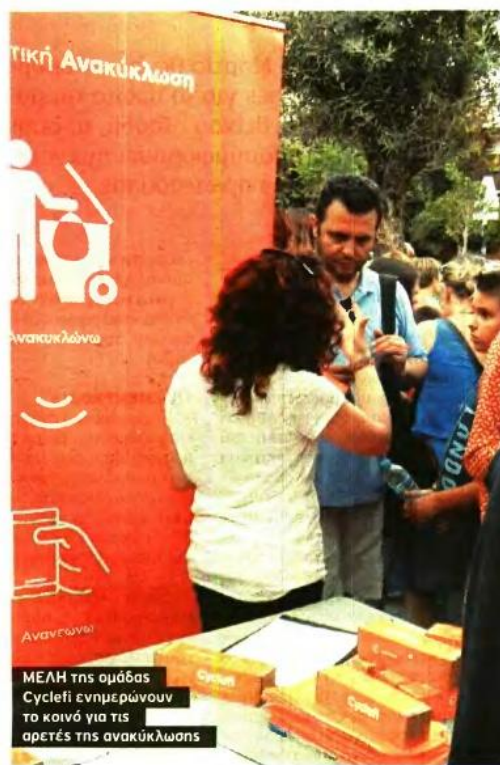
ΜΕΛΗ της ομάδας Cyclefi ενημερώνουν το κοινό για τις αρετές της ανακύκλωσης